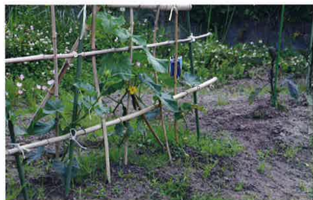
きゅうりとなすも大きくなり収穫が楽しみです