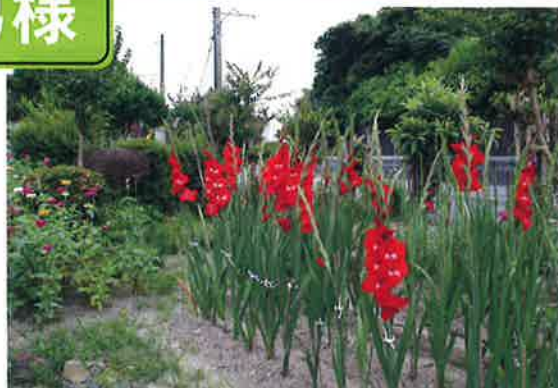
グラジオラス・百日草が綺麗に咲きました