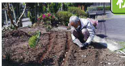
グラジオラス・リアトリスの植え付け お花の管理もしています