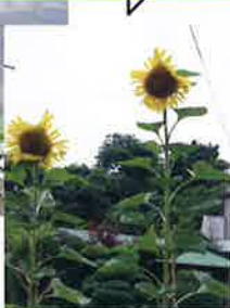
大きな向日葵が 咲きました