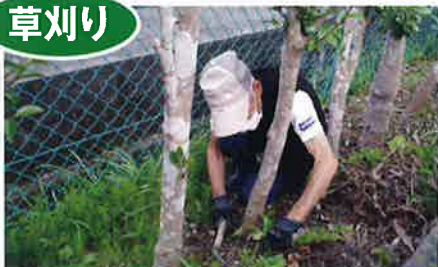
進んで草刈りをして下さり とても助かります