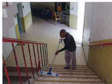
土日は、階段と廊下の 掃除をやってくれいつもピカピカ