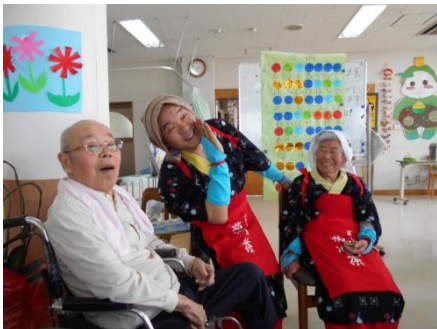
きれいな茶娘との記念撮影

5/4~9 の第 2 週にデイサービスで新茶会を実施しました。お茶処で暮らす私達にとって、身近なお茶ですが、改めて美味しさ・採れることのありがたさを感じられる茶会となるように取り組みました。まず、おいしさを感じる重要なポイントとして臭覚を考え、お茶の葉を香炉で焚きデイサービス内を良い香りにしました。次に見た目で印象深くと考え、職員やご利用者有志による茶娘や法被の衣装着用、「茶摘み」の歌を流したり、演奏することで聴覚からお茶を意識するようにしました。様々な感覚を活用して今年の新茶を味わいました。