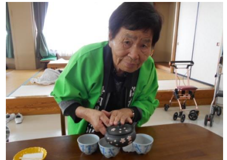
おいしいお茶が入りました