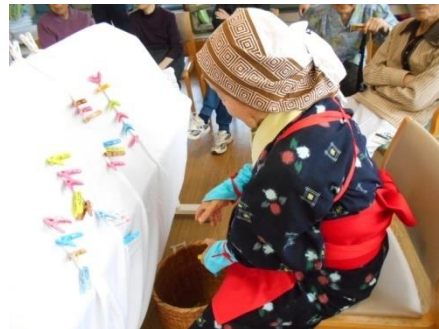
洗濯バサミで茶摘みゲーム