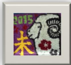
ロールピクチャの力作