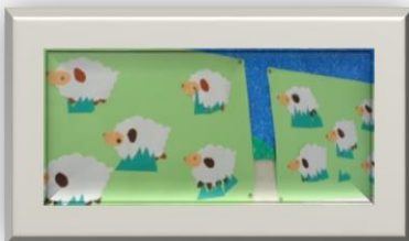
個性豊かな羊がたくさん